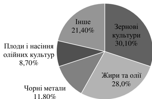
Рис. 3. Товарна структура провідних груп українського експорту до Нідерландів (МЗС України, 2022)

Згідно даних Державної служби статистики, обсяг українського експорту товарів до Нідерландів у 2021 р. склав 2262575 тис. дол (або ж 125,5% до 2020 р.), тоді як обсяг