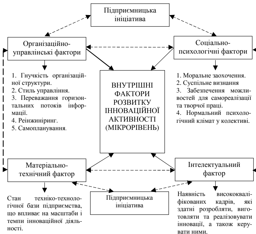
Рис. 3. Внутрішні фактори розвитку інноваційної активності та їх взаємозв'язок на мікрорівні (авторська розробка)

Внутрішні фактори розвитку інноваційної активності – це безпосередньо ті фактори, на які підприємство має вплив. Серед факторів мікрорівня варто виділити організаційно-управлінські фактори, соціально-психологічні фактори, матеріально-технічні та інтелектуальні фактори (рис. 3). Така система факторів і формує підприємницьку ініціативу, що і формує підприємництво в цілому і його інноваційну активність.