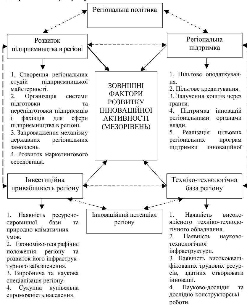
Рис. 2. Зовнішні фактори розвитку інноваційної активності та їх взаємозв’язок на мезорівні (авторська розробка)

розвитку інноваційної активності та їх взаємозв’язок на мезорівні відображено на рисунку 2.